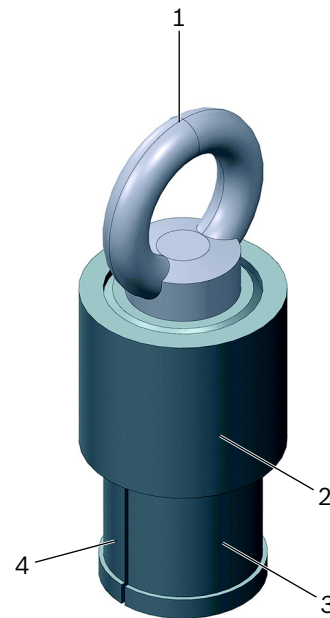
Fig. 1: Estrattore T40050