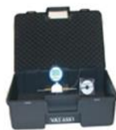
VAS 6551 (dia. 7.5 mm)