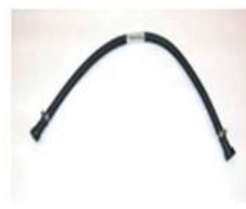
VAS 6550/2 Cavo (dia. 7.5 mm)