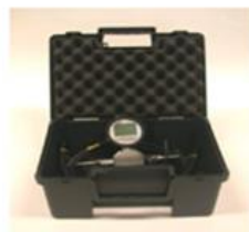
VAS 6550 (dia. 7.5 mm)

SOCIETÀ CON SOCIO UNICO SOGGETTA ALLA ATTIVITÀ DI DIREZIONE E COORDINAMENTO DI VOLKSWAGEN AG.