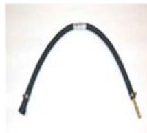
VAS 6550/1 Cavo (dia. 7.5 mm)